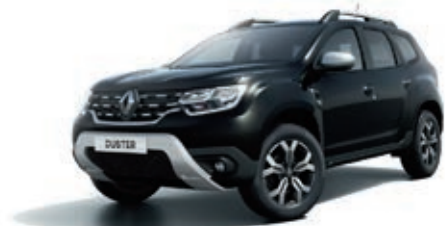
Noir Nacré (PM)