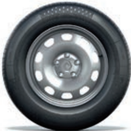
jante en tôle 16"

OV : opaque vernis. PM : peinture métallisée.