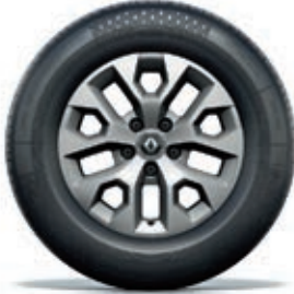
jante en aluminium stylisée 16" Oraga