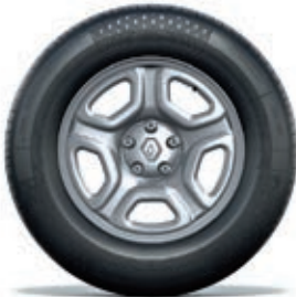
jante en aluminium stylisée 16" Fidji