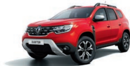
Rouge Fusion (PM)