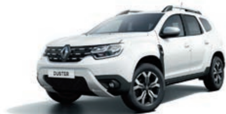
Blanc Glacier (OV)