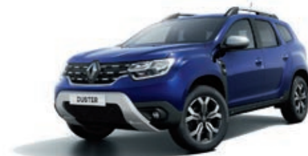
Bleu Iron (PM)