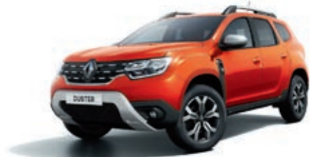
Orange Arizona (PM)

OV : opaque vernis. PM : peinture métallisée.