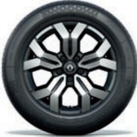
jante en alliage 17" Tergan