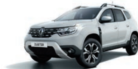
Gris Highland (PM)