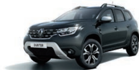
Gris Comète (PM)